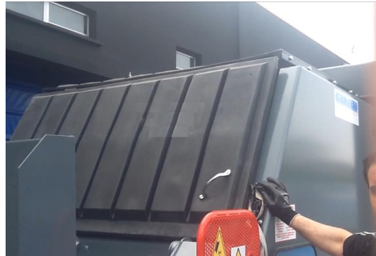
• Capot de fermeture (Option)