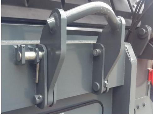
• Anneau de préhension rabattable