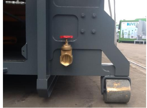
• Vanne de vidage (option)